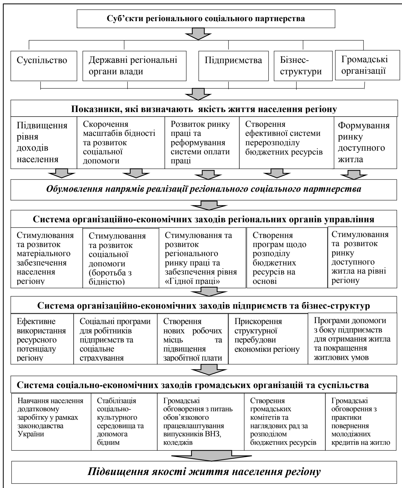
Рис. 3. Модель регіонального соціального партнерства щодо підвищення якості життя населення

соціальний захист, безпеку життя; участь особи у громадсько-політичній і культурній діяльності; соціальна забезпеченість людини, сім'ї, соціальних і національних меншин; рівень соціально-комунальної інфраструктури. Проведене дослідження довело, що для оцінки якості життя населення та потреб