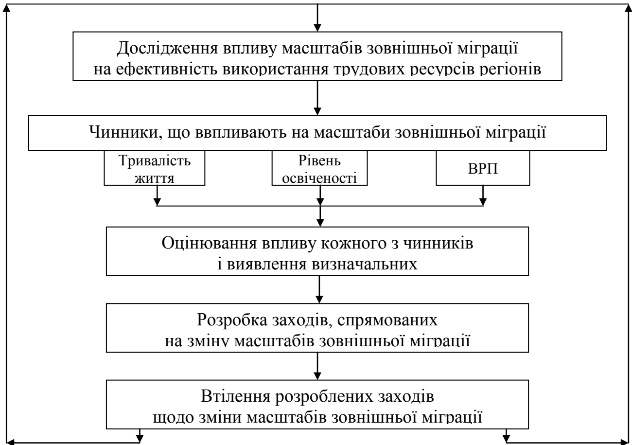
Рис. 2. Модель управління масштабами зовнішньої міграції трудових ресурсів регіонів.

Удосконалена модель управління масштабами зовнішньої міграції як одним із чинників згладжування просторової асиметрії розміщення й функціонування регіональних трудових ресурсів (рис. 2).