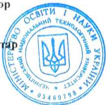
О. І. Гонта