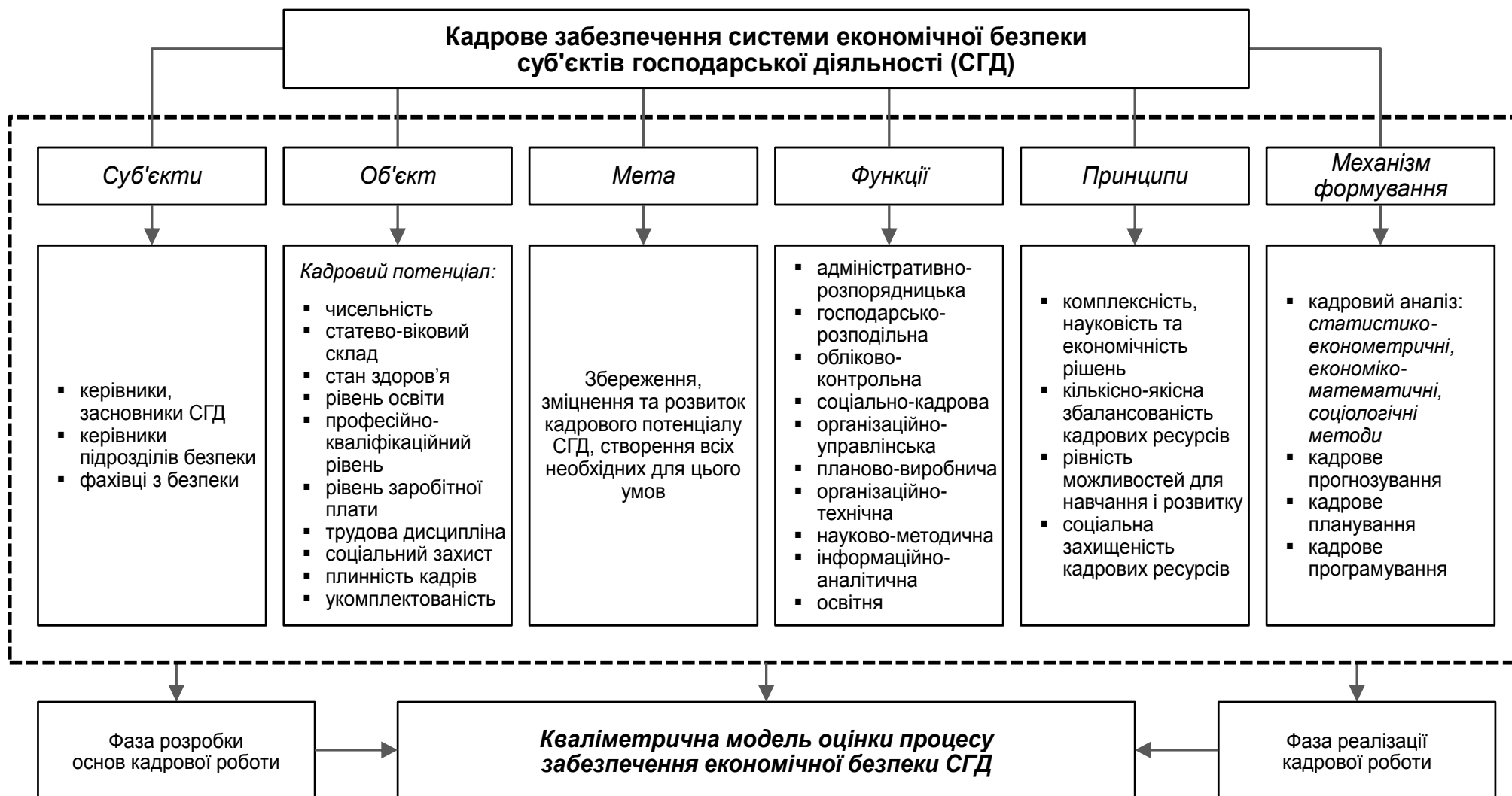
Рис. 1. Концептуальна модель формування кадрового забезпечення системи економічної безпеки СГД (складено автором)