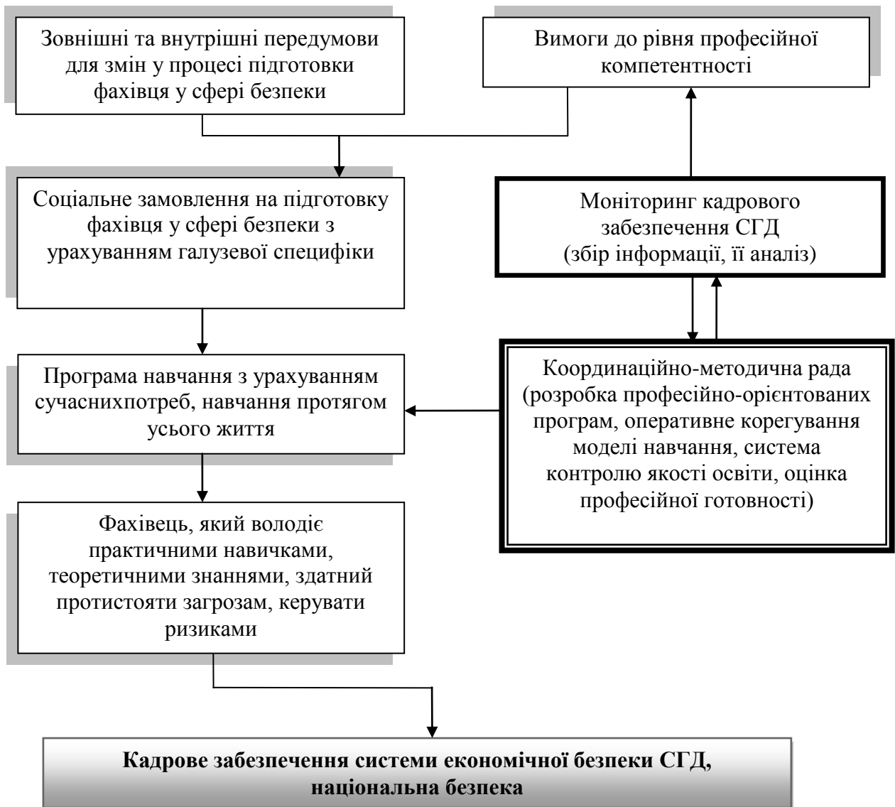
Рис. 4. Інформаційно-аналітична модель підготовки фахівця у сфері безпеки

щоденного досягнення прогресу у справі готовності здобувачів вищої освіти працювати фахівцями сфери безпеки (рис. 4).