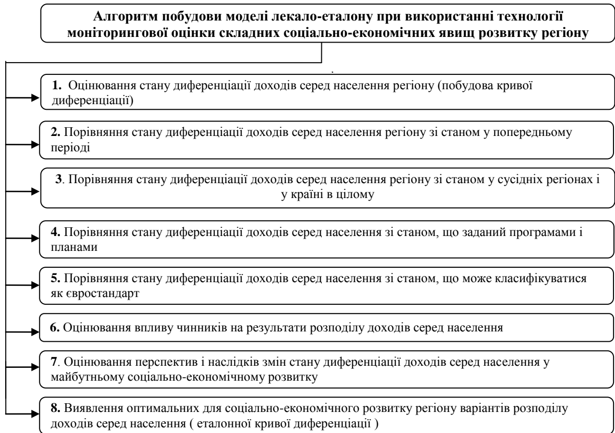
Рис. 3. Алгоритм побудови моделі лекало-еталону при використанні технології моніторингової оцінки складних соціально-економічних явищ розвитку регіону

У дисертаційній роботі розроблено алгоритм побудови лекало-еталону (рис. 3):