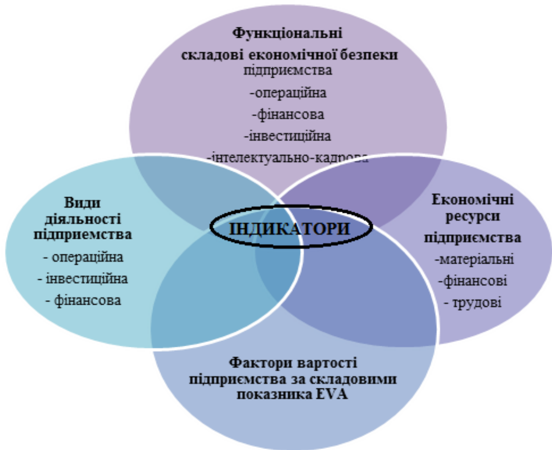
Рис. 1.1. Взаємозв'язок складових економічної безпеки, економічними ресурсами видами діяльності та факторами вартості.

(індикаторів). Схематично наведений взаємозв'язок зображений на рис. 1.1 [81, с. 15]